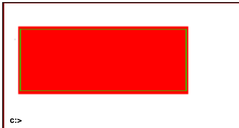
Figura 2. Rectángulo realizado con caracteres de caja.

Para dibujar un rectángulo como el de la figura siguiente, se usan los caracteres de caja que representan líneas horizontales y verticales, esquinas en diferentes posiciones, intersecciones y rellenos de diferentes tipos y grosores.